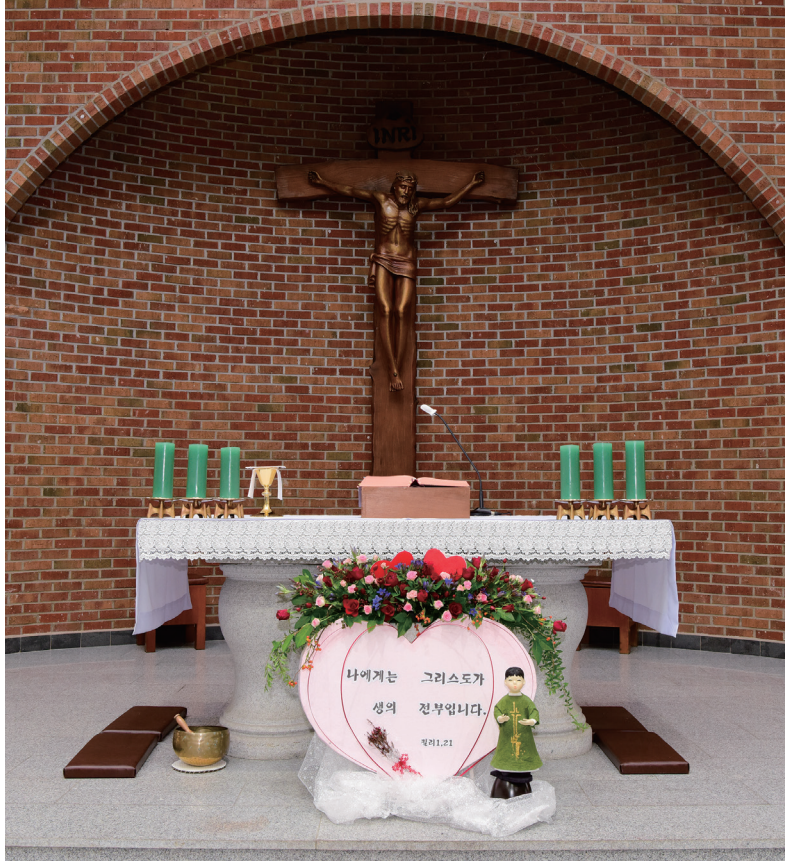
봉동성당(4지구) | 사진 : 원금식 대건안드레아(교구 가톨릭사진가회)

제 1 독 서 신명 6,2-6 화 답 송 시편 18(17),2-3 7.3나ㄷ-4.47과 51(◎ 2) ◎ 저의 힘이신 주님, 당신을 사랑하나이다. 제 2 독 서 히브 7,23-28 복 음 환 호 송 요한 14,23 참조 ◎ 알렐루야. ○ 주님이 말씀하신다. 누구든지 나를 사랑하면 내 말을 지키리니 내 아버지도 그를 사랑하시고 우리가 가서 그와 함께 살리라. ◎ 알렐루야. 복 음 마르 12,28ㄱ-34 영 성 체 송 시편 16(15),11 참조 주님, 저에게 생명의 길 가르치시니, 당신 얼굴 뵈오며 기쁨에 넘치리이다.